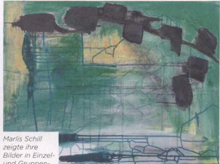
Marlis Schill zeigte ihre Bilder in Einzel- und Gruppenausstellungen. Hier „Akropolis ade“ (links) und „Fragile Balance“